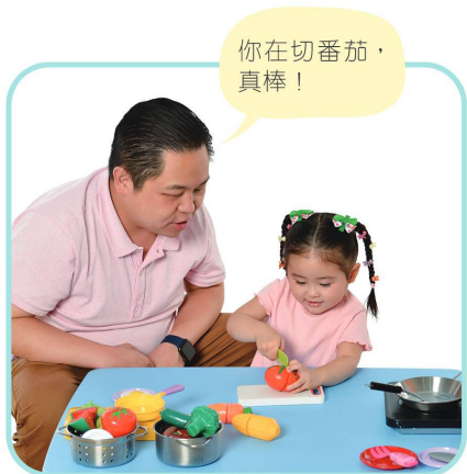
方法 1：用話語描述寶寶正在做甚麼。

扮家家酒 是寶寶常玩的角色扮演遊戲，通過這個遊戲，寶寶更容易吸收話語的內容。過程中，爸媽可運用以下的方法，引導寶寶多開口說話。