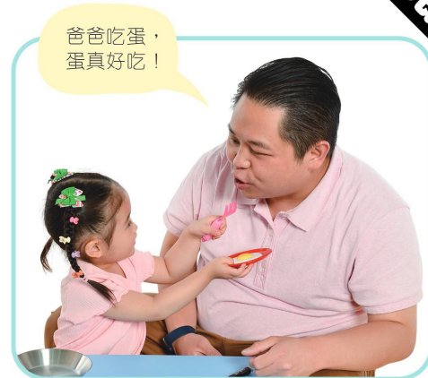
方法 4：爸媽示範說出句式，讓寶寶模仿學習。