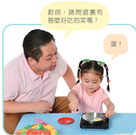
方法 3：嘗試製造話題，吸引寶寶的注意力。