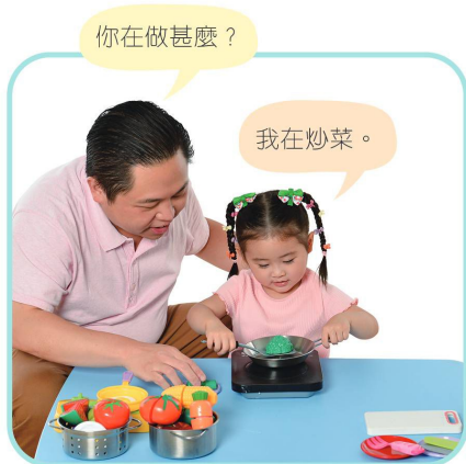
方法 2：引導寶寶說話，描述自己的動作。